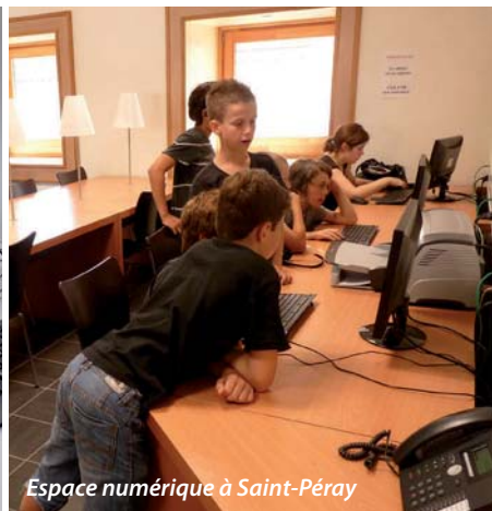
Espace numérique à Saint-Péray