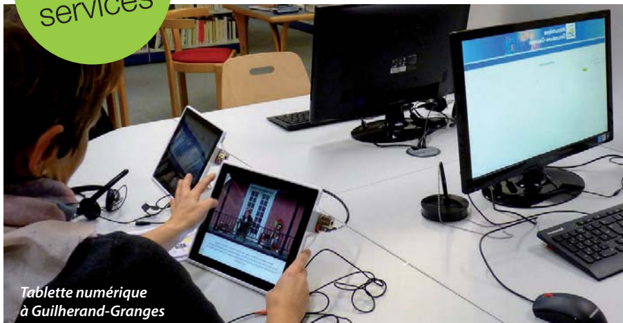
Tablette numérique à Guilhaud-Granges