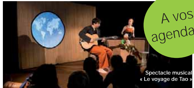
Spectacle musical « Le voyage de Tao »

Du 1 er au 26 octobre : Exposition de photographies « Dans la nudité d'un jour sans nuit » - Collectif Photo726.